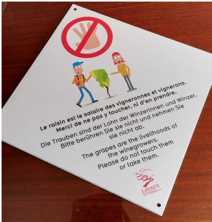
Panneau réalisé par LPm et la CVVL pour lutter contre le vol de raisin. A disposition des vigneronns pour le prix de Fr. 10.- TTC