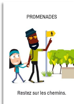
Autres pictogrammes développés par LPm pour la charte des visiteurs